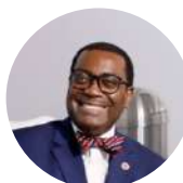
Akinwumi ADESINA Président BANQUE AFRICAINE DE DEVELOPEMENT