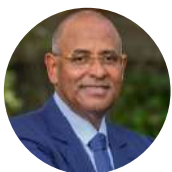
Patrick ACHI Premier ministre REPUBLIQUE DE CÔTE D'IVOIRE