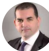
Sami AGLI Président CONFÉDÉRATION ALGÉRIENNE DU PATRONAT CITOYEN (CAPC)