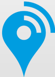
Interventions sur site