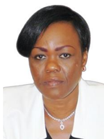
Niale Kaba Ministre de la Planification et du Développement, République de Côte d'Ivoire