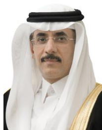
Khaled Al Aboodi PDG, Société islamique pour le développement du secteur privé