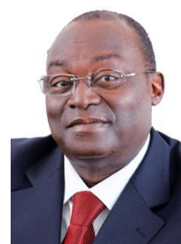
Tiemoko Meyliet Kone Gouverneur, Banque centrale des Etats d' Afrique de l' Ouest (BCEAO)